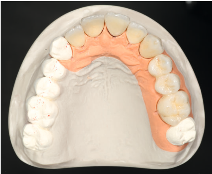
▼ 4a bis ▼ 4c