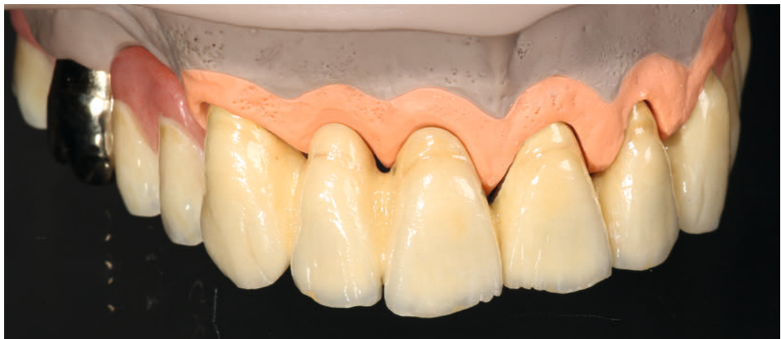
▼ 3a bis ▼ 3b